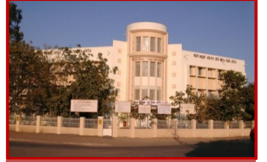
શ્રીમતી ન.ચ.ગાંધી અને શ્રીમતી ભા.વા.ગાંધી મહિલા આર્ટ્સ એન્ડ કોમર્સ કોલેજ