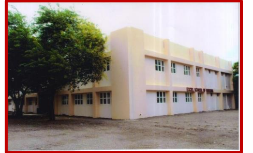
એક્સેલ સ્કુલ ઓફ નર્સિંગ