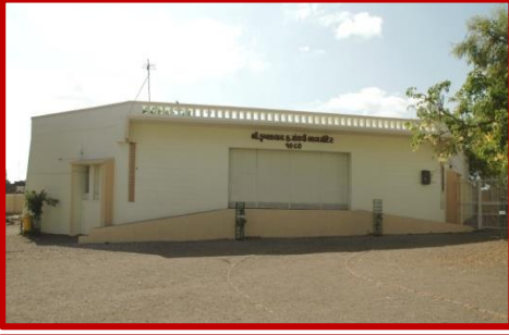
શ્રી કૃષ્ણલાલ હ.સંઘવી બાલમંદિર