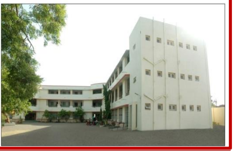
શ્રી મુક્તાલક્ષ્મી મહિલા વિદ્યાલય શ્રીમતી ન.ચ.ગાંધી કુમારી વિદ્યામંદિર